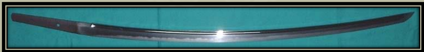
"Osafune Yukisada" (Kr. U. 1376-ban)