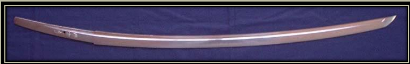
Modern Tachi pengék.