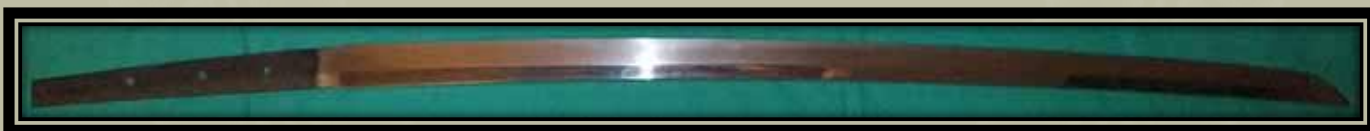
Rövidített Tachi penge a 13. századból