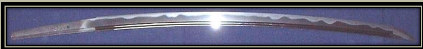
"Yukihira" a 20. századból.