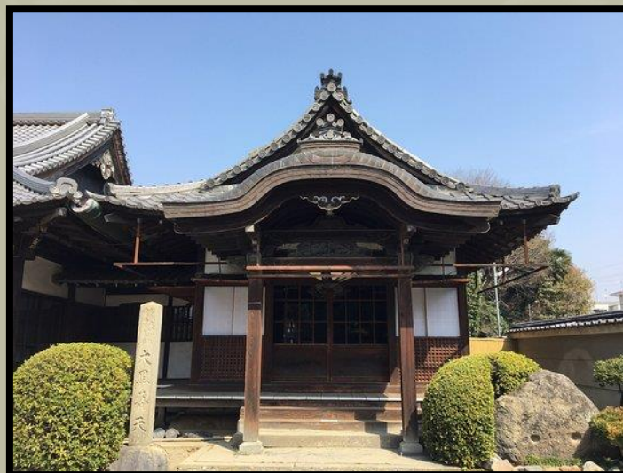
A kiotói Hokoji templom

Minden tartomány parasztjainak szigorúan tilossá vált kardot, rövidkardot, íjat, lándzsát, lőfegyvert vagy más típusú fegyvert birtokolniuk. Ha felesleges eszközöket tartanak, az éves bérleti díj ( nengu ) beszedését a parasztok megnehezíthetik, és provokáció nélkül is lehet lázadásokat szítaniuk... A fenti módon összegyűjtött kardok és rövidkardok nem vesznek kárba. Szögek és csavarok lesznek belőlük a Nagy Buddha építésénél [a kiotói Hōkōji kolostorban].