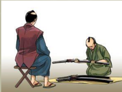
A kardok begyűjtése, 1588

Minden tartomány parasztjainak szigorúan tilossá vált kardot, rövidkardot, íjat, lándzsát, lőfegyvert vagy más típusú fegyvert birtokolniuk. Ha felesleges eszközöket tartanak, az éves bérleti díj ( nengu ) beszedését a parasztok megnehezíthetik, és provokáció nélkül is lehet lázadásokat szítaniuk... A fenti módon összegyűjtött kardok és rövidkardok nem vesznek kárba. Szögek és csavarok lesznek belőlük a Nagy Buddha építésénél [a kiotói Hōkōji kolostorban].