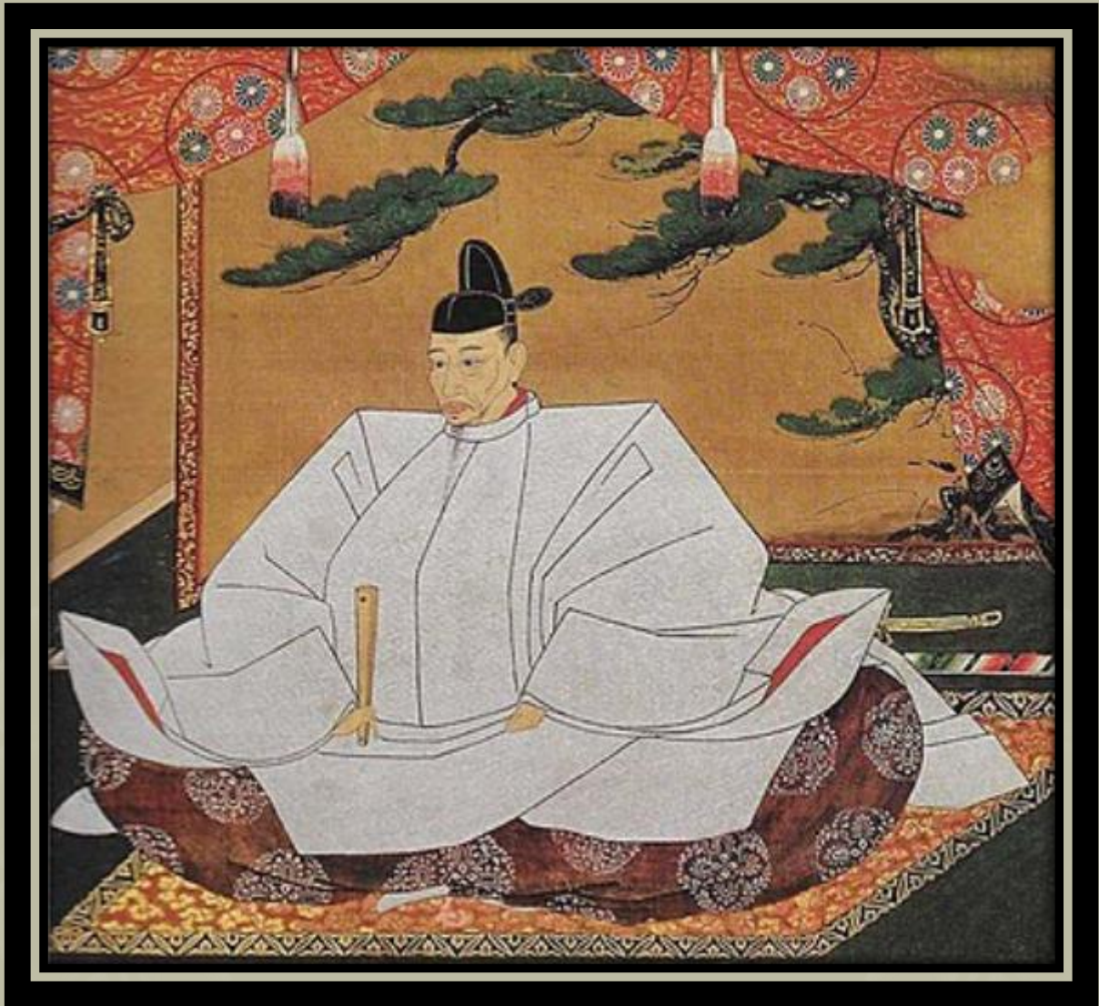
Toyotomi Hideyoshi, Mitsunobu Kanou, a Kodaiji-Templom tulajdonában.

A Wikimedia Commonsból, az ingyenes médiatárból