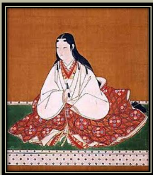
Hojo Masako Shogun.

Őt "Ama Sógun"-nak vagy "Apáca Sógun"-nak nevezték. Éles eszű és tehetséges, de kemény, kritikus és gyakran gonosz politikus volt.