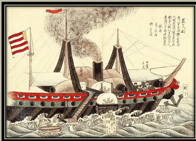
1853. július 8: Perry horgonyt vet amerikai hajókkal az Edo-öbölben.

1853 körül Matthew Perry amerikai parancsnok amerikai hadihajókból álló flottával érkezett Yokohama partjaihoz, és követelte, hogy Japán nyissa meg kikötőit a nemzetközi kereskedelem előtt. Vonakodva beleegyeztek, és Yokohama tengerparti települése hamarosan a külkereskedelem központjává vált.