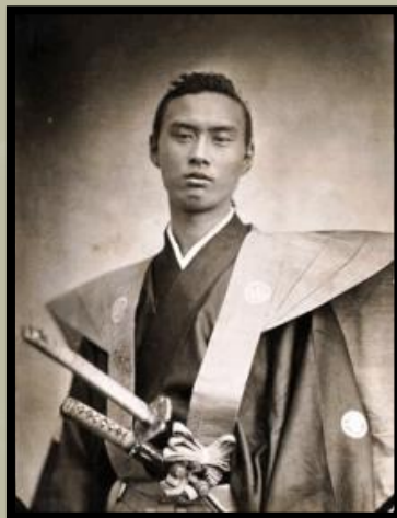
Ikeda Nagaoki 1864-ben

1864-ben a Tokugawa -sogunátus, a feudális Japánt uraló katonai diktátorok parancsára Ikeda Nagaoki helyi kormányzót Európába küldte, hogy megoldja a jokohamai kikötővel kapcsolatos égető nézeteltérést.