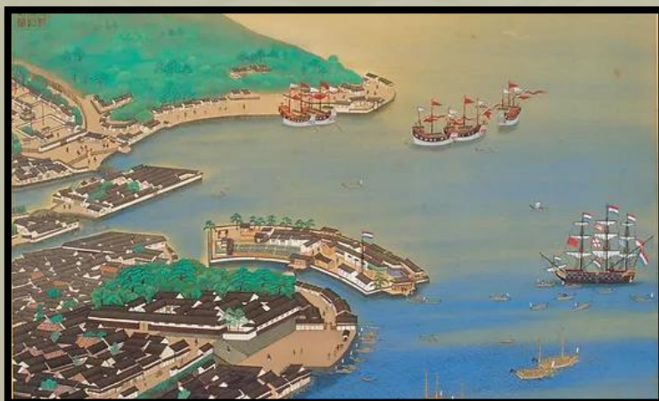
A mesterséges Dejima-sziget a Nagaszaki öbölben.

A 19. század második felében Japán egzisztenciális válaszüthöz érkezett. Az európai gyarmatosítók hatalmas területeket foglaltak el Ázsiában, valamint Afrikában és Amerikában. Hogy távol tartsa őket, Japán a 17. század óta a sakoku nevű szigorú elszigetelődési politikát folytatta, amely a kultúra megőrzése érdekében megpróbálta elzárni a szigetet a kívülállók elől. E politika részeként szigorúan tiltották a kereszténységet, és csak a kínaiakkal és a hollandokkal kereskedtek.