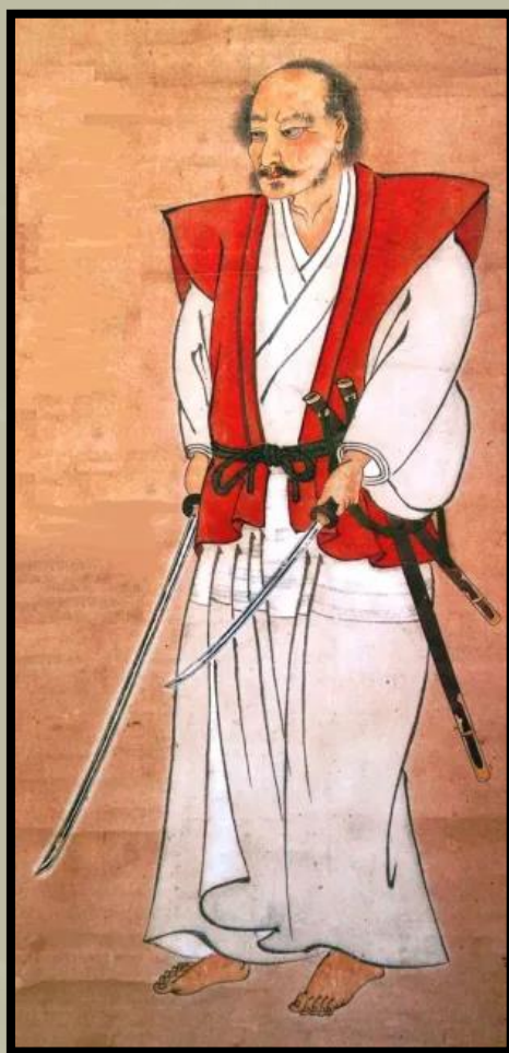
Miyamoto Musashi önarcképe

Miyamoto Muszasi (1584-1645 körül) a történelem egyik legkiválóbb párbajhőse volt. Állítása szerint mintegy hatvan párbajt vívott, amelyek közül sok (ellenfelei szerencsétlenségére) életre-halálra ment. A vérontással teli élete ellenére Muszasinak volt egy művészi oldala is. Az a mű, amely miatt a legtöbben ismerik, az a Go Rin No Sho , vagyis az Öt gyűrű könyve , amelyet nem sokkal halála előtt, 1645-ben írt, a mesterművének számít. De nem a szavak voltak az egyetlen művészeti forma, amelyben jeleskedett. Ugyanaz a munkamorál és technikai szorgalom, amely Muszasi -t legendás kardforgatóvá tette, mesteri festővé is formálta.