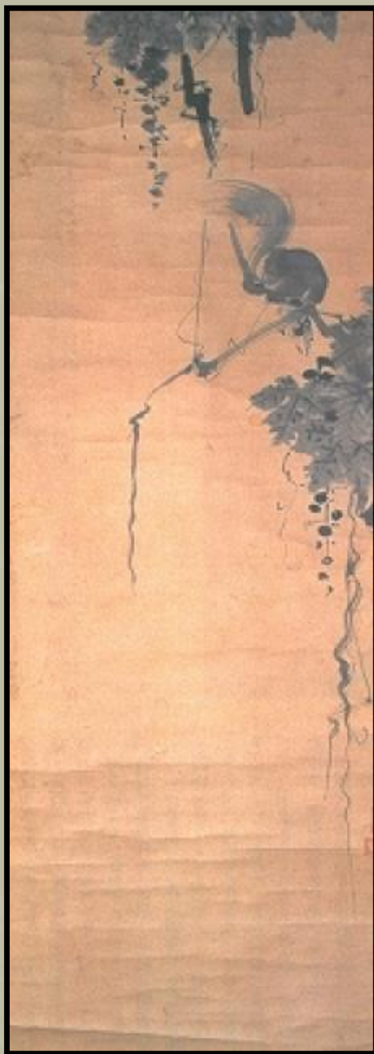
Szőlő és egy mókus, Miyamoto Musashi

Senki sem tudja pontosan, hogy Miyamoto Muszasi mikor kezdett el festeni, de úgy tudjuk, hogy az 1630-as években már alkotott. Stratégiai elméje megmutatkozott munkáin - az általa készített festmények precíz erőfeszítéssel lettek megalkotva, hogy zavarba ejtő hatást érjenek el. Művészete sok tekintetben minimalista jellegű volt, fő festőanyaga az egyszerű tinta volt.