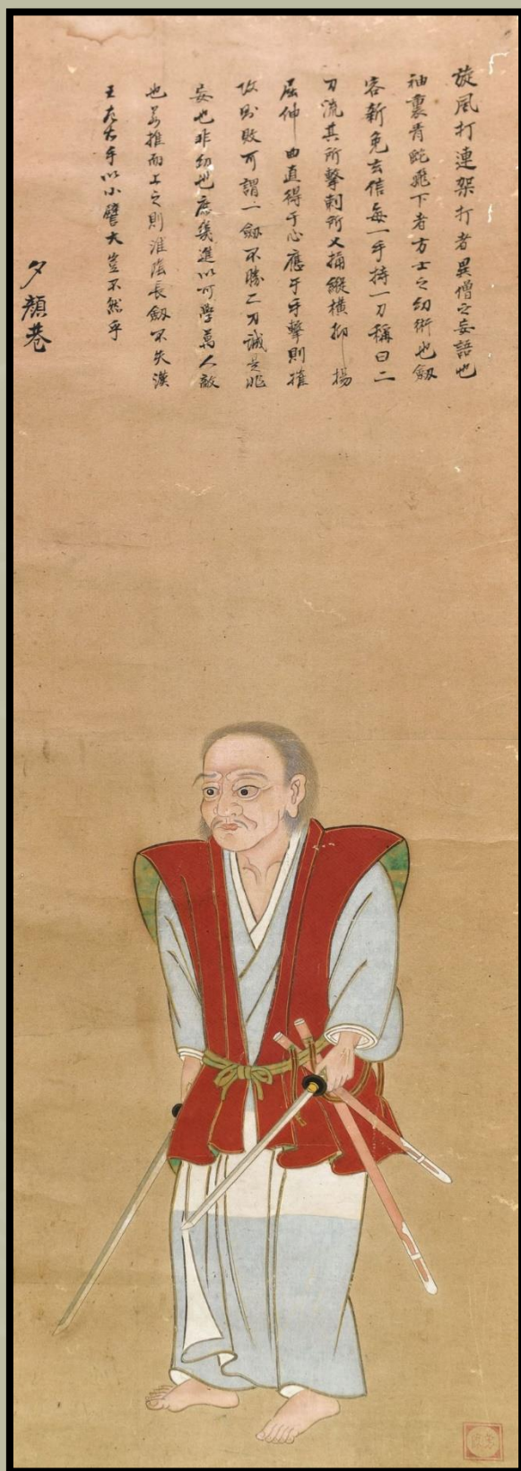
Miyamoto Musashi önarckép

A fordítás az alábbi cikk felhasználásával készült: https://thehistorianshut.com/2017/11/07/besides-being-a-deadly-swordsman-and-duelist-miyamoto-musashi-was-also-a-skilled-painter/