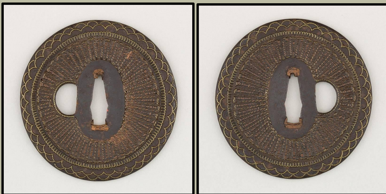
"Shingen" stílusú Tsuba, kb. 1700.

Anyaga: vas, réz, sárgaréz. Hossza 7,9 cm, szélessége 7,6 cm, vastagsága 0,5 cm. Súly: 99,2 g.