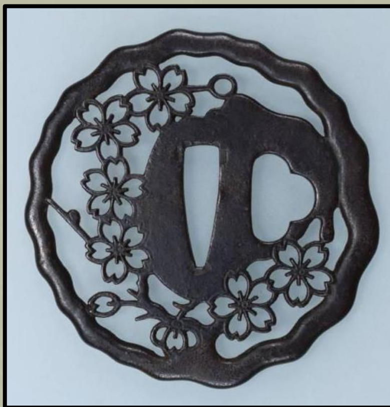
Tsuba sakura virágokkal. Saotome stílus.

Végül a Saotome -stílus abban különbözött a többtől, hogy a tsubák ebben a stílusban olvadt formájúak voltak, mintha elmosódtak volna a hőtől. A Saotome tsubákon a áttört és a vésett díszítés tipikus képe egyaránt a krizantém volt.