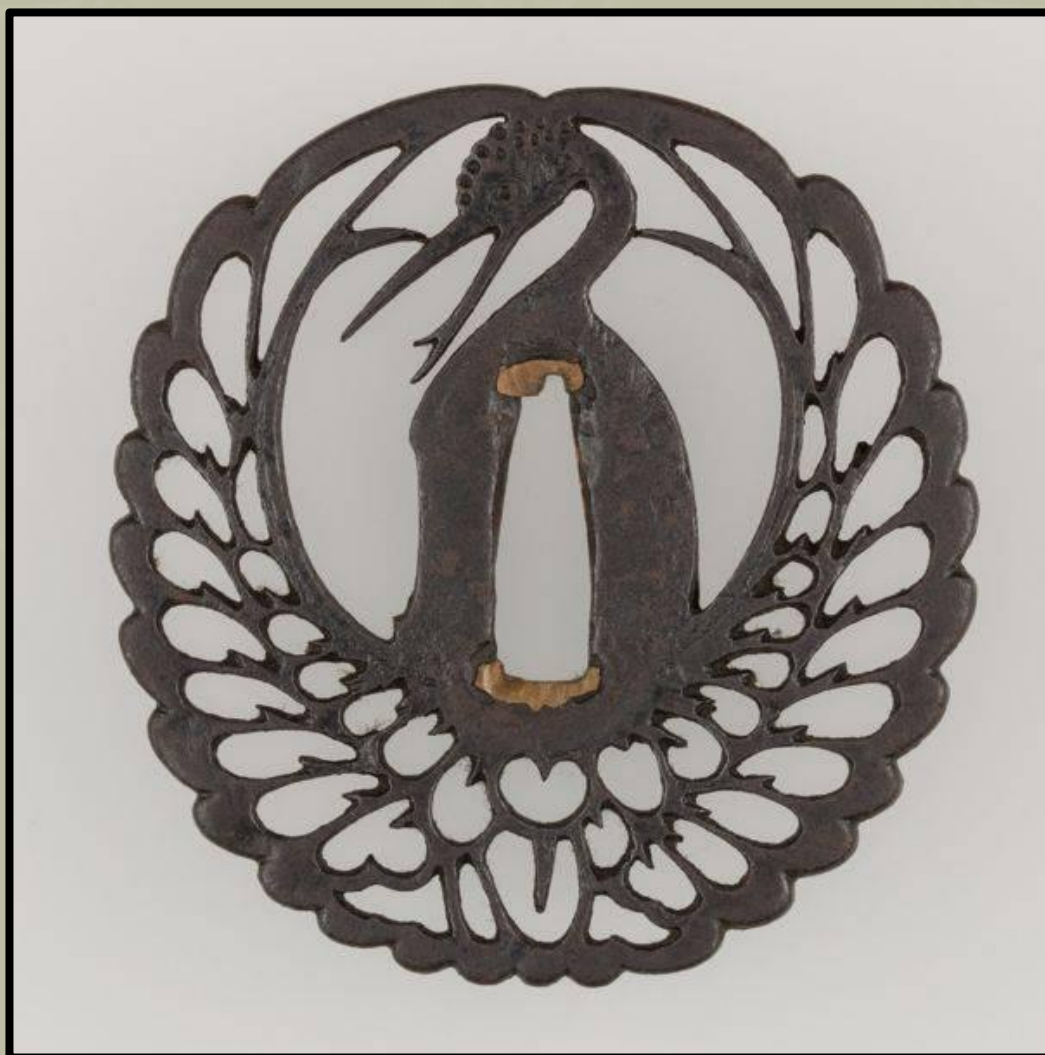
"Daru" stílusú Ji-Sukashi Tsuba . XVII. század.

Anyagok: vas és réz. Hossza 8,6 cm, szélessége 6,4 cm, vastagsága 0,5 cm. Súly: 68 g.