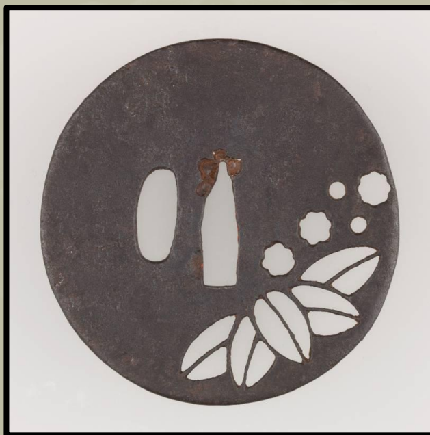
Ko-Tosho Tsuba, XVI. század.

Nos, nekünk ma már csak az marad, hogy megcsodáljuk valamikori tudásukat *.