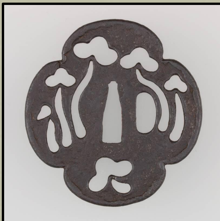
Ko-Tosho Stílus, XVIII. század.

Hogyan jöttek létre az iskolák és a stílusok? Ez nagyon egyszerű. Például a Kamakura -korszakban (1185-1333) a kamakura -i stílus a Kínából kölcsönzött képeken és technikákon alapult. Virágokat, pillangókat és geometriai formákat ábrázoló áttört minták, visszafogott és lakonikus ornamentikák és minimalista cselekmények jellemezték. Később, amikor a XVI. század végén a XVI. Japán uralkodója, Toyotomi Hideyoshi Fushimi -ban, Yamashiro tartományban telepedett le, elkezdte pártfogolni a fegyverkovács mestereket és szamurájai nagy számban rendelték tőlük kardokat és kézvédőket; itt alakult ki a Fushimi stílus. Aztán jött a Tokugawa -korszak, és ezek a mesterek szétszóródtak az egész országban, és megalapozták az új iskolák kialakulását.