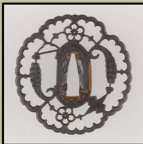
Kyo-sukasi tsuba. XVI. század.

A különböző stílusok azokhoz is kapcsolódtak, akik ezeket a tsubákat készítették - a fegyverkészítő mesterekhez vagy a páncélkovácsokhoz. A fegyverkovácsok készítették a Ko-Tosho tsubákat, a páncélkovácsokat pedig Ko-Katsushi néven osztályozták. A különbség közöttük az, hogy a Ko-Tosho tsubákat ugyanazok a kovácsok készítették, akik magukat a kardokat is kovácsolták. A Ko-Katsushi tsubák pedig a páncélkészítők munkái voltak, vagyis páncéllal együtt készültek, ami miatt e két stílus és technológiájuk jelentősen különbözött egymástól.