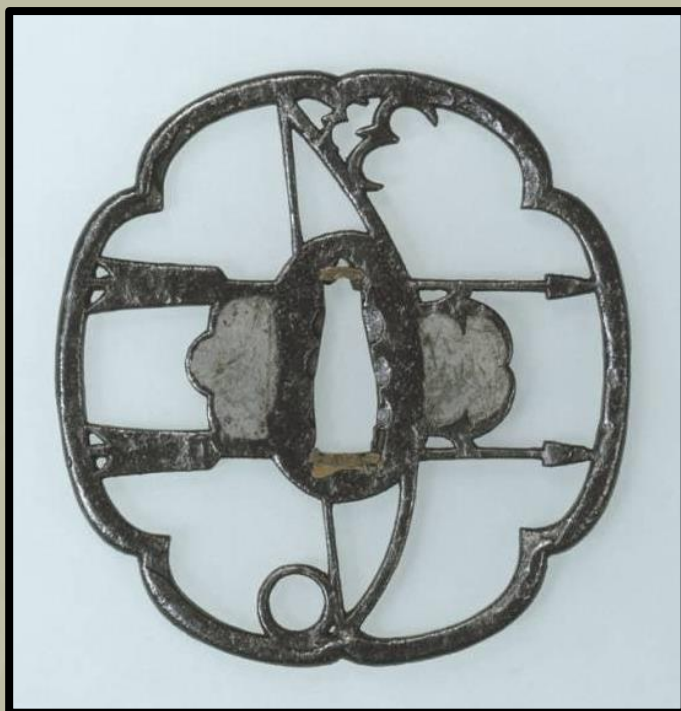
Íj és nyílvessző. Owari Tsuba stílus. Muromachi korszak. (Tokiói Nemzeti Múzeum)

Jól láthatóak a tsuba felszínének egyenetlensége. Másrészt azonban minden résznek és vonalnak nagyon határozott, nem lekerekített élei vannak.