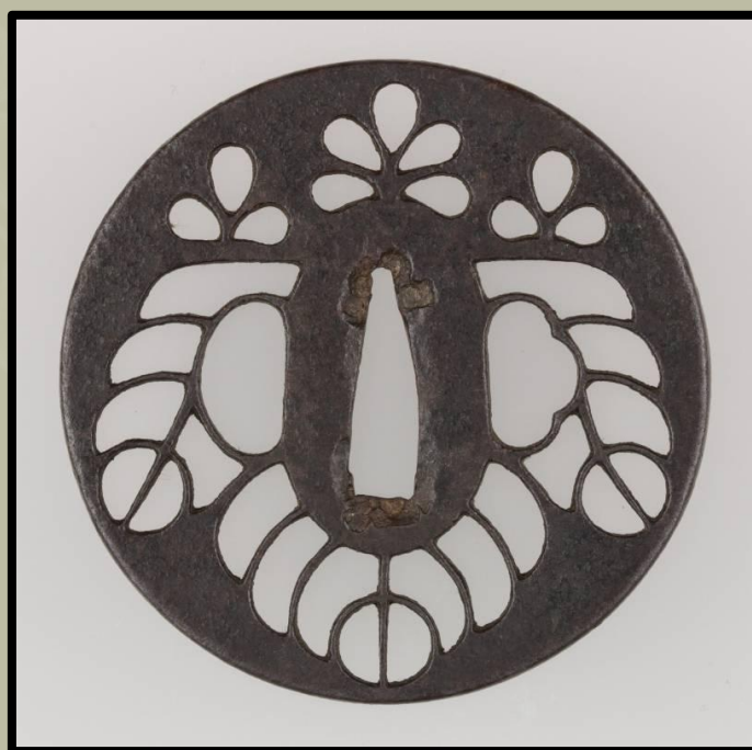
Kyo-Sukashi tsuba stílus. XVIII. század.

Amikor a XV. században Kiotó városa Japán kulturális központjává vált, természetesen a legjobb fegyverkovácsok is odaköltöztek, ami azonnal hatással volt termékeik, köztük a tsubák minőségére is. Kialakult egy másik stílus, a Ko-Sukasi , amelynek divatját az egyik vélemény szerint a hatodik sógun, Ashikaga Yoshinori (1394 - 1441), a másik szerint pedig a nyolcadik; Ashikaga Yoshimasa (1435 - 1490) indította el. Pontos bizonyíték, hogy az új trend valójában melyikükhöz is köthető eddig nincs. Legalábbis a legkorábbi ismert, ebből a stílusból származó tsubák az 1500-as évekre nyúlnak vissza. Ma ezek a legrágább és legértékesebb tsubák a gyűjtők körében.