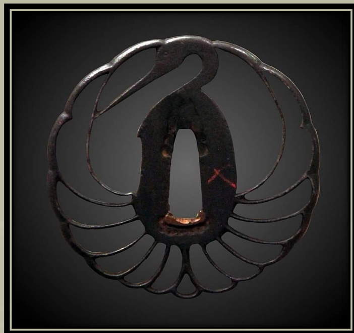
Egy másik Ji-Sukasi Tsuba .

(Keleti Művészetek Múzeuma (Gimet Múzeum) Párizs, Franciaország)