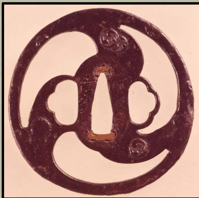
Owari stílus. A Muromachi Momoyama korból. (Tokiói Nemzeti Múzeum)