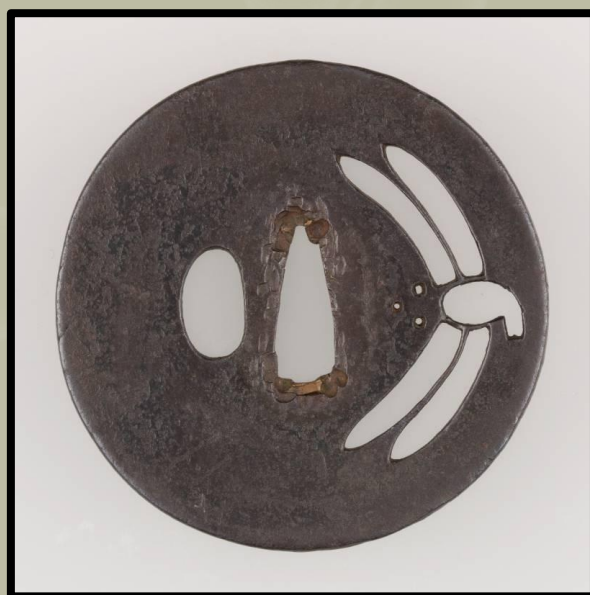
"Szitakötő". Stílusú Ko-Tosho Tsuba, XVI. század.

Minden ilyen iskolának megvolt a maga stílusa és a technika sajátosságai. Ugyanakkor különböző iskolák mesterei dolgozhattak azonos stílusban és fordítva - egy iskola mestere másolhatta más iskolák és mesterek stílusát!