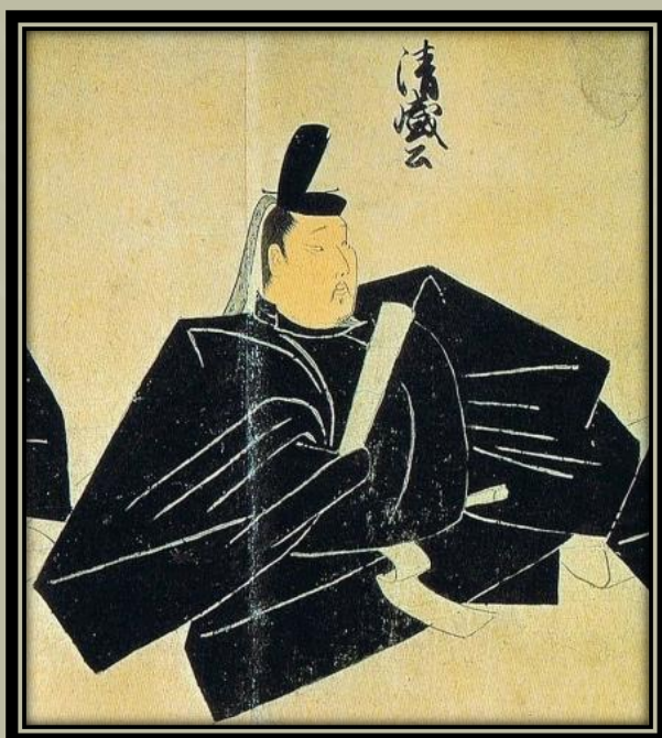
Taira -no-Kiyomori a 14. században. A képet Fujiwara Tamenobu festette.

A császári udvar és az arisztokraták Kiotóban maradtak. Míg a Kamakura Bakufu (kormány) rendelkezett a katonai, rendőri és politikai hatalommal, addig a császári udvaré volt a közigazgatási hatalom. Bár olyanok voltak, mint két nagy rivális, és különböző területeken irányították az országot, de megőrizték a hatalmi egyensúlyt egymás között.