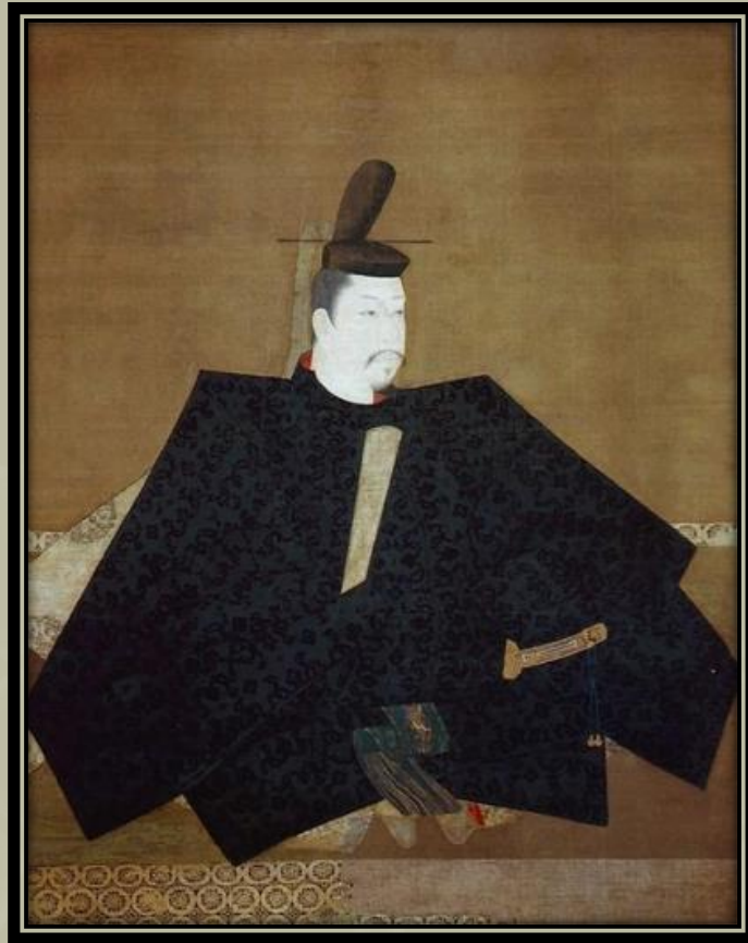
A Jingo-Ji szentély tulajdonában lévő Fujiwara Takanobu által 1178-ban festett Minamoto-no-Yoritomo.