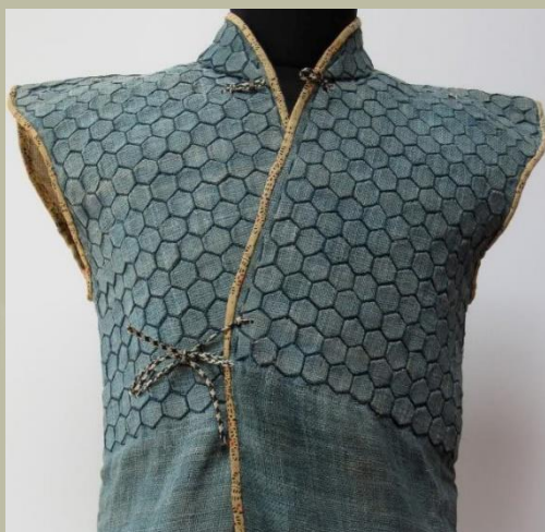
A Kikko kisméretű vas vagy edzett bőr, hatszög alakú páncéllemezek Japán páncélok építéséhez.