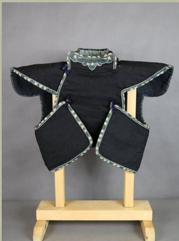
Manchuria klasszikus típusa, amelyet mellpáncéllal együtt kell viselni. A páncél a textilrétegek között van elrejtve.

Ez megmagyarázhatja azt a tényt, hogy maga a Manchira szó úgy hangzik, mint a spanyol Mantilla szó, amely egy olyan ruhadarab, amelyet az első japánba érkezett európaiak viseltek. Ha valami, akkor határozottan inkább a divat befolyása volt, nem pedig a praktikusság.