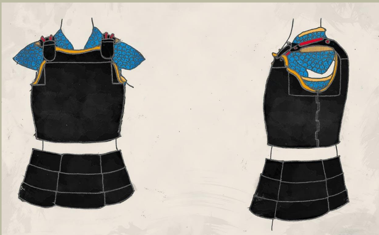
Egy vázlat, amely bemutatja a mellvert plus Manchira konfigurációját.

Azok számára, akik ismerik az európai páncélokat, ez a kiegészítő egyaránt funkcionálhatott kipárnázott „kabátkaként” vagy egy beépített kiegészítővel, láncing formájában.