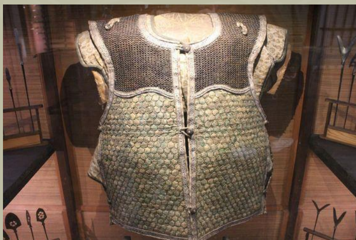
Egyfajta Manchira páncél, kikko , és láncvérttel kombinálva.

Ez magyarázható azzal, hogy a Yuan hadsereggel való összecsapások és a 13. század végén és a 14. század elején és közepén tapasztalható zavargások miatt a Japán hadviselés sokkal inkább a közelharcra összpontosított, mint korábban.