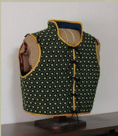
Mellényszerű Manchira típus.

Ezenkívül egy hasonló, de kevésbé széleskörű páncélkomponenst, amelyet kifejezetten a hónalj réseinek fedezésére használtak, a Wakibiki már a Nanban kereskedelem előtt is létezett.