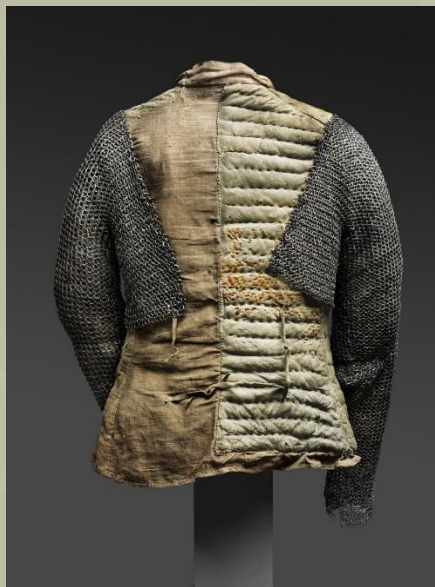
Az európai verzió.

Ahogy a Tōsei gusoku (当世具足) páncél részletes elemzésében említettük, ezt a felszerelést valójában arra használták, hogy fedezzék azokat a réseket, amelyek esetleg az alap szilárd és merev páncéldarabok fedetlenül hagytak.