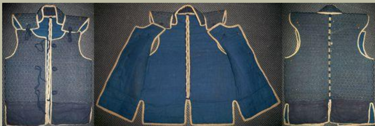
Egy önmagában is viselhető Manchira páncél.

Tekintettel arra, hogy rugalmasnak kellett lennie ahhoz, hogy beleférjen a páncélzat alá, a Manchira általában Kikkō-gane ből készült, ami hatszögletes lemezekből és a Karutagane hoz kapcsolt láncsodronnyal kapcsolódtak. Lánc ( Kusari - 鎖) vagy ezek kombinációjából készült. Leggyakrabban kissé párnázva, selyemmel vagy textilréteggel borítva, amelyet díszítettek és felékesítettek, különösen akkor, ha azt magában kellett viselni.