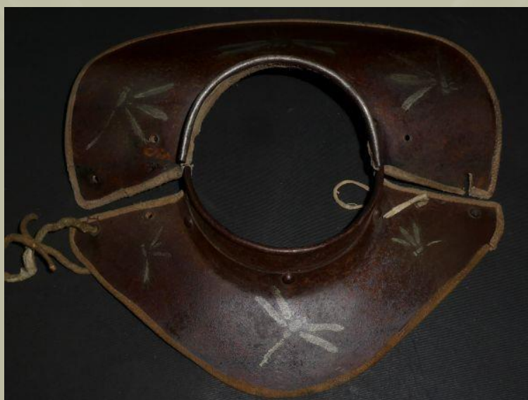
Egy meglehetősen egyszerű és kicsi Nanban manchira .

Van még egy másik Manchira típus is, amely meglehetősen egyedi a Nanban manchira (南蛮満智羅), amely lényegében az európai Gorget ből alakult ki, amelyet a páncél felett kellett viselni.