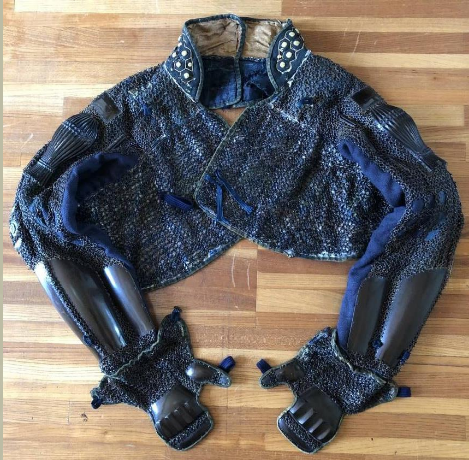
Tominaga gote „beépített” Manchira-val.