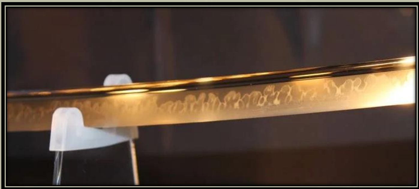
A Hamon a Sanchomo másolatán.

A " Yamatorige " név a " Yama ", azaz "hegy", a " Tori ", azaz "madár" és a " Ge/Ke ", azaz "toll" vagy "haj" karakterekből áll. A név állítólag a bonyolult és dinamikus megjelenésű - Hamon ("penge mintázat" - a pengén az edzési folyamat során létrejövő vizuális hatás) miatt jött létre, amely egyaránt utalhat a rézfácán tollára vagy az égő hegyekre és mezőkre.