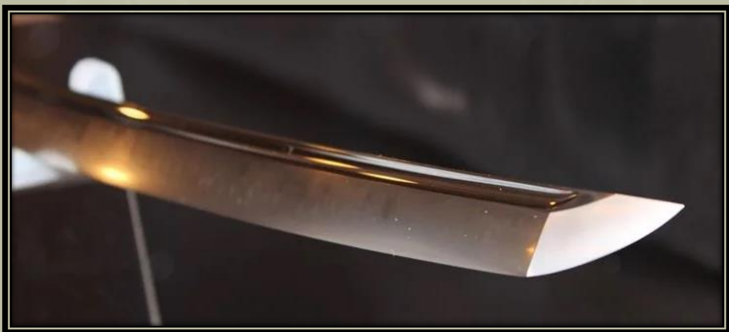
A Sanchomo kard másolata.

A japán kardok iránti érdeklődés nemcsak Japánban, hanem más országokban is egyre nő. Ebből a helyzetből kiindulva és a japán kardok újraértékelésének tendenciáját követve a „Yamatorige Homecoming project” várhatóan tovább növeli a japán kardok megbecsülését mind nemzeti, mind nemzetközi szinten.