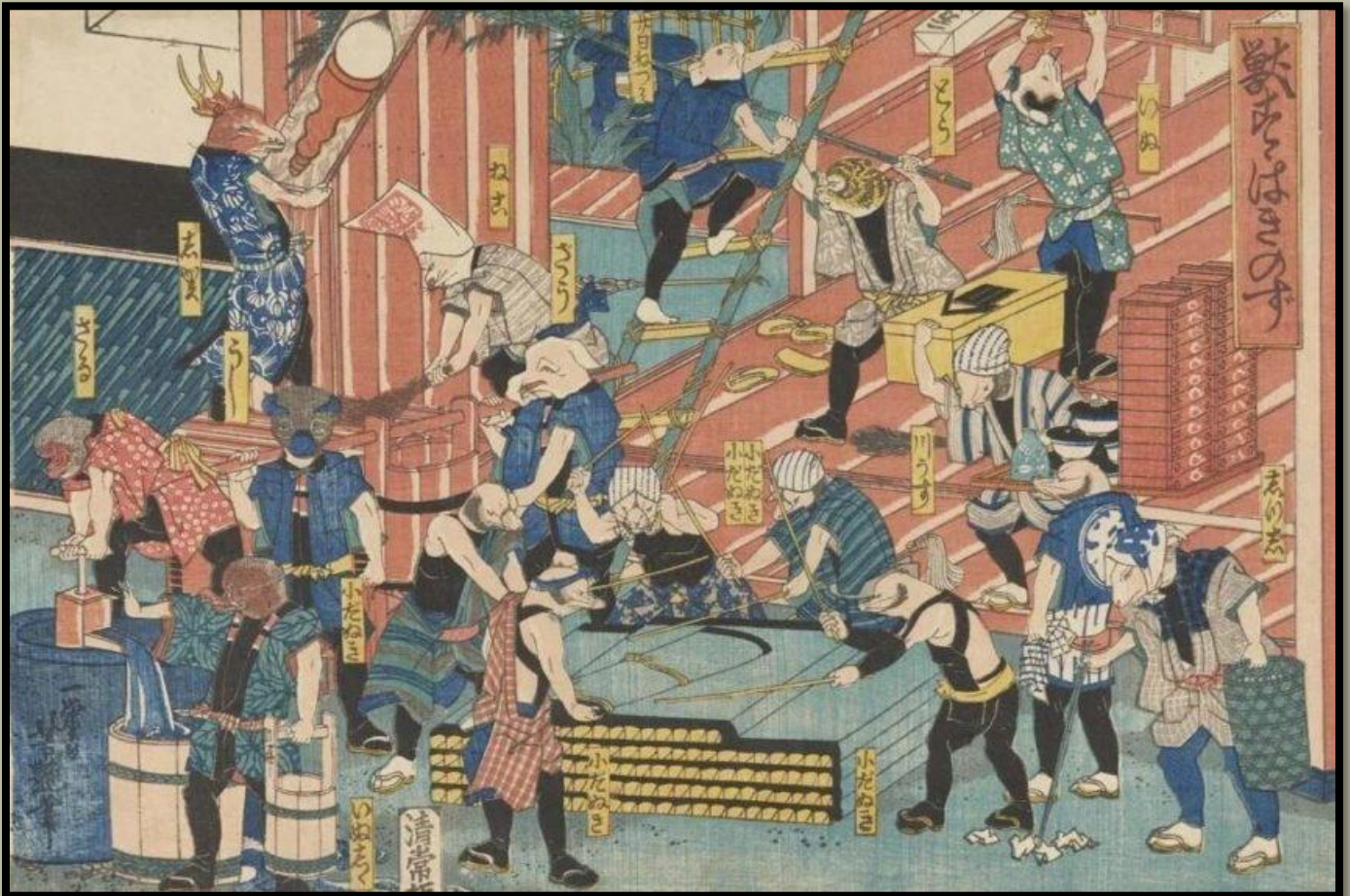
Utagawa Yoshitsuya illusztrációja

Az újév a végek és a kezdetek időszaka. Ahogy az egyik év átvált a másikba, a világ számos részén az átmenetet szimbolizáló tevékenységeket végeznek. Japánban az újév előtti ünnepek egyik legfontosabb része az O-Souji vagy Osouji (大掃除), a "nagytakarítás". Az Osouji az az időszak, amikor mindenki összejön és kitakarítja otthonát, irodáját, üzletét stb. Ez lehetővé teszi, hogy felrisszülve és rendtelenségtől mentesen vágjunk neki a következő évnek.