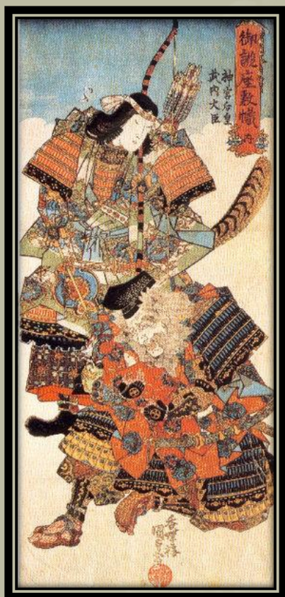
Jingū császárnő és minisztere, Takeuchi .

Az ókori Japán hagyományos feljegyzések szerint Jingū császárnő a 14. uralkodó, Chūai felesége volt, aki 192-200 között uralkodott, és fia, Ōjin régense volt. Jingū császárnő állítólag rendelkezett egy pár isteni ékszerrel, amely felruházta őt az árapályok irányításának képességével. Ez biztosította számára Korea győzelmes és vér nélküli meghódítását abban az évben, amikor férje meghalt. A legenda szerint az akkor még meg nem született fia, Ōjin , akit később Hachiman , a háború istene néven istenítettek, három évig maradt Jingū császárnő méhében. Ez időt adott a császárnőnek, hogy befejezze Korea meghódítását és visszatérjen Japánba.