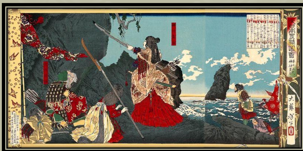
Jingu császárnő Koreába érkezik, egy 1880-as Yoshitoshi -festményen.

Jingū császárné (神功皇后 Jingū-kōgō ), más néven Jingū régensasszony (神功天皇 Jingū-tennō ), Japán egyik Onna-bugeisha - japán női harcosnő a felsőbb osztályból. Ők a szamurájok mellett válaszoltak a kötelesség hívására, és bátran harcoltak a csatában. Jingū császárnő férje 201-ben bekövetkezett halálától kezdve egészen fia, Ōjin császár 269-es trónra lépéséig uralkodott.