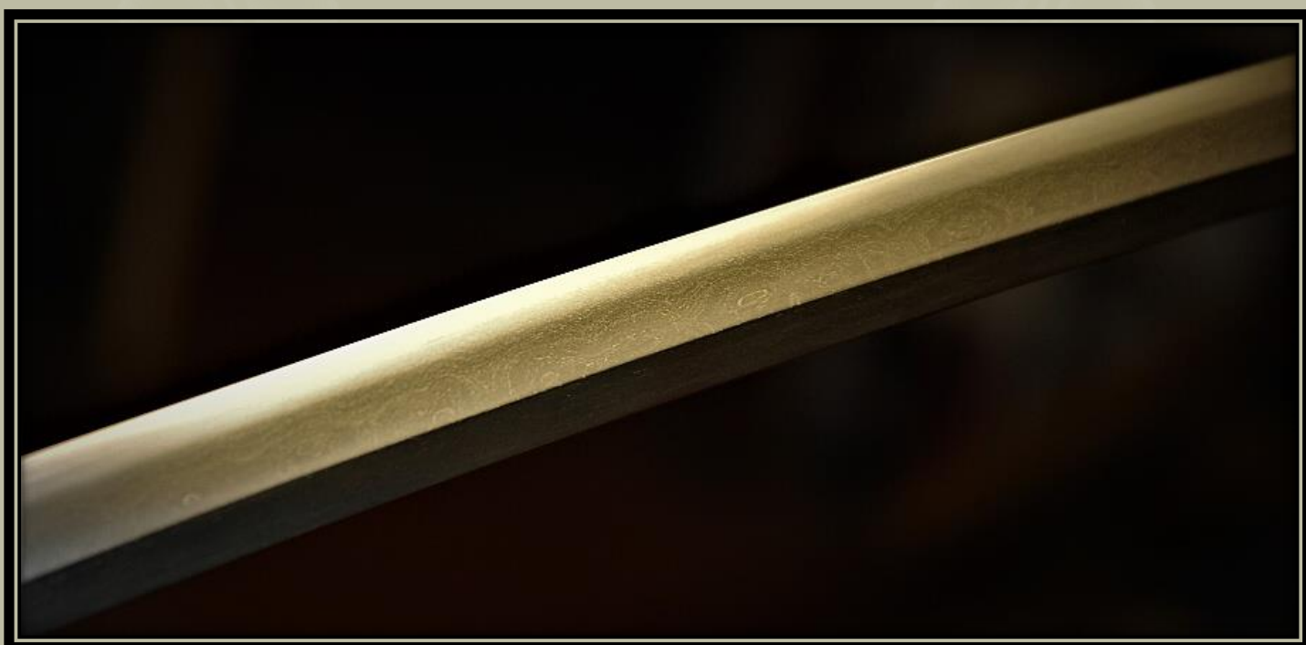
Gassan penge (Pavel Bolf által elkészítve).

Ezek az iskolák különböző acélösszetételűek, a Hada (hajtogatási minta) eltérő szerkezete és a Hamon (edzési vonal) is eltérő. Az egyéb edzési hatások, mint például a KINSUJI , SUNAGASHI , UTSURI vagy NIE is különböznek. Ezért amikor egy bizonyos iskola pengéjét készítem el, igyekszem megőrizni az adott iskola jellegzetes vonásait.