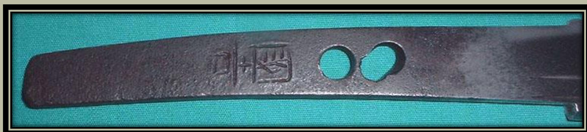
13.-14.Századi Tanto "Kuniyoshi" (Awataguchi iskola)