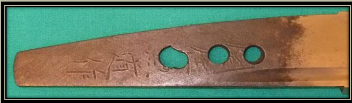
16. század Tanto "Kanemichi"

"Seki ju Kanemichi saku" (Kanemichi készítette, aki Seki-ben él)