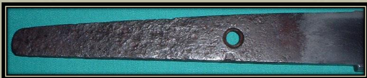
12. és 13. századi Tanto "Shinsoku".

Amikor a Nakago rozsdásodása nem természetes, akkor is hamisnak tekinthetjük, ha az aláírás valódi.