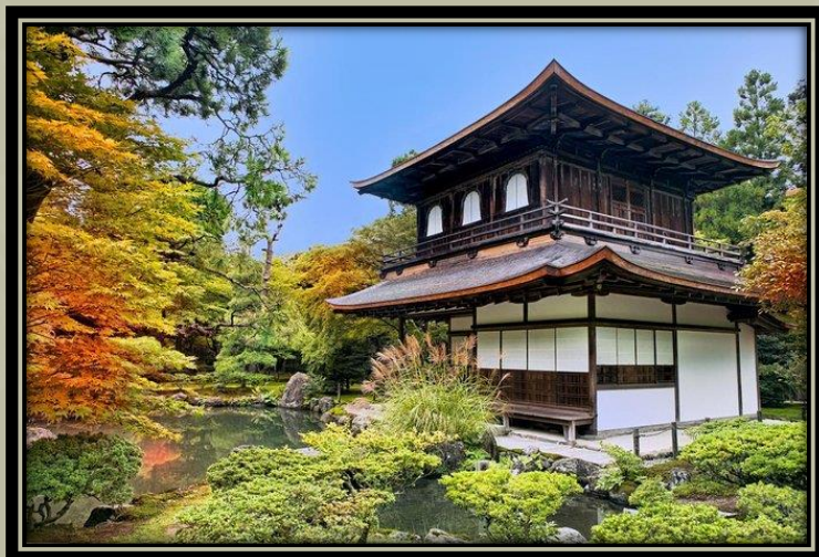
A Ginkakuji (銀閣寺, Ezüst Pavilon)

Egy zen templom Kiotó keleti hegyei ( Higashiyama ) mentén.