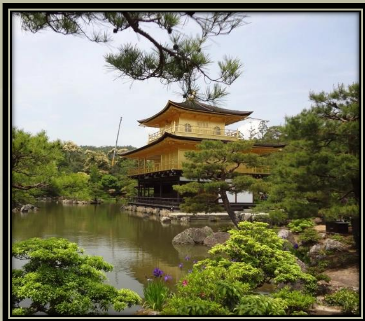
Kinkaku-Ji templom (金閣) Arany Pavilon

Az Onin-no-Ran esemény generálta a következő időszakot, amelyet Sengoku -periódusnak (戦国時代) neveztek, azaz a Harcos Államok időszakának. A Sengoku időszak alatt Japán körülbelül harminc független területre oszlott és egymással harcoltak, amíg végül Japán egyesült Oda Nobunaga , Toyotomi Hideyoshi , Tokugawa Iyeyasu által.