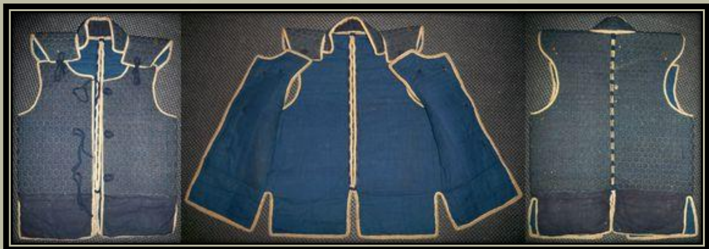
Egy önmagában is viselhető Manchira páncél.

Tekintettel arra, hogy rugalmasnak kellett lennie ahhoz, hogy beleférjen a páncélzat alá, a Manchira általában Kikkō-gane -ből készült, ami hatszögletes lemezekből és a Karutagane -hoz kapcsolt láncsodronnyal kapcsolódtak. Lánc ( Kusari - 鎖) vagy ezek kombinációjából készült. Leggyakrabban kissé párnázva, selyemmel vagy textilréteggel borítva, amelyet díszítettek és felékesítettek, különösen akkor, ha azt magában kellett viselni.