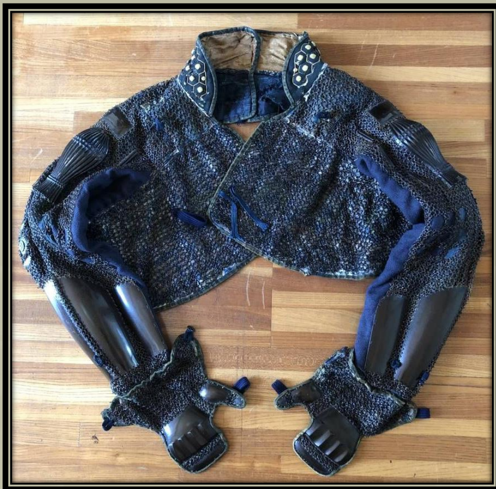
Tominaga gote „beépített” Manchira-val.

Original source: https://gunbai-militaryhistory.blogspot.com/2020/01/manchira-japanese-auxiliary-armor.html