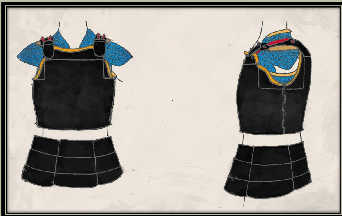
Egy vázlat, amely bemutatja a mellvért plus Manchira konfigurációját.

Azok számára, akik ismerik az európai páncélokat, ez a kiegészítő egyaránt funkcionálhatott kipárnázott „kabátkaként” vagy egy beépített kiegészítővel, lánccing formájában.