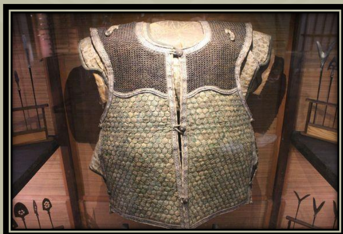
Egyfajta Manchira páncél, kikko , és láncvérttel kombinálva.

Ez magyarázható azzal, hogy a Yuan hadsereggel való összecsapások és a 13. század végén és a 14. század elején és közepén tapasztalható zavargások miatt a japán hadviselés sokkal inkább a közelharcra összpontosított, mint korábban.