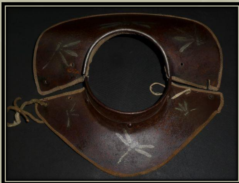
Egy meglehetősen egyszerű és kicsi Nanban manchira .

Van még egy másik Manchira típus is, amely meglehetősen egyedi a Nanban manchira (南蛮満智羅), amely lényegében az európai Gorget ből alakult ki, amelyet a páncél felett kellett viselni.