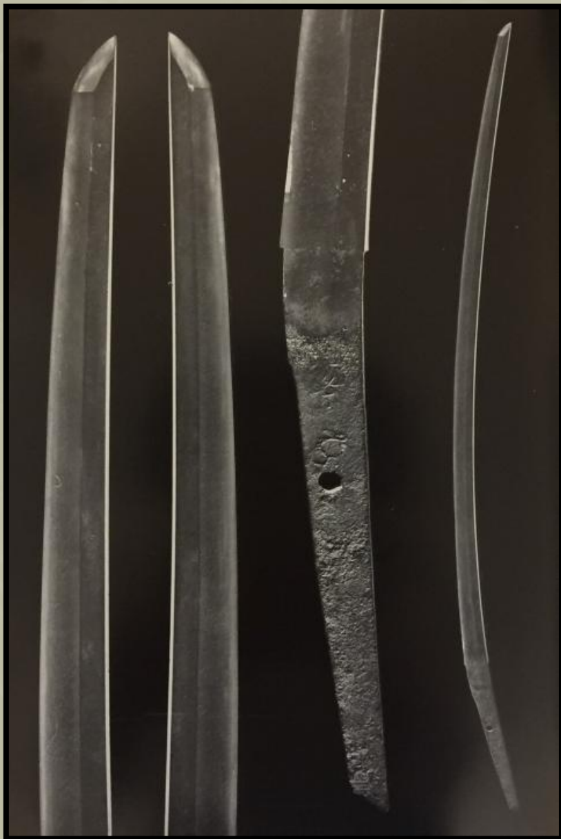
Sanjō Munechika (三条宗近)

A Yamashiro-den kardstílus ma is a Heian -korszak szellemiségét és esztétikai világát testesíti meg, s a korszak kardművességének egyik legreprezentatívabb iskolájaként tartják számon.