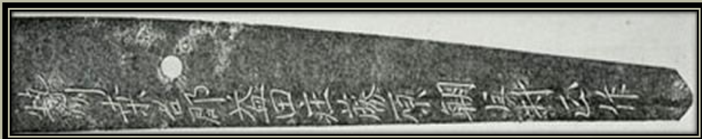
Egy kard felirattal mindig többet ér, mint Mei nélkül.

Ez általában úgy történik, hogy az egyik oldal vastagságát csökkentették annak érdekében, hogy az aláírt oldal érintetlen maradjon. Így a kard még mindig az eredeti kovácsnak tulajdonítható, ami nagyon fontos volt (és mind a mai napig nagyon fontos), különösen, ha a kovács jól ismert a munkáiról.