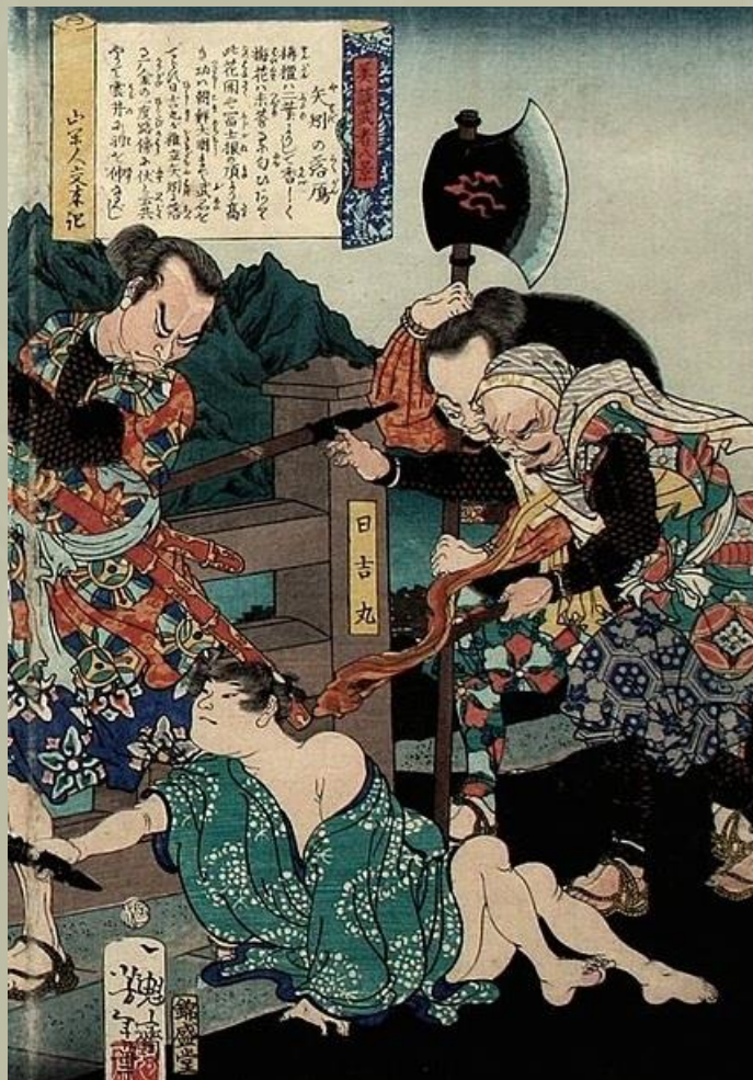
Egy igazán hatalmas fejsze, amelyet az Ukiyo-e "Ereszkedő libák a Yahagi hídnál" egyik szakaszából származik. Yoshitoshi, 1868.