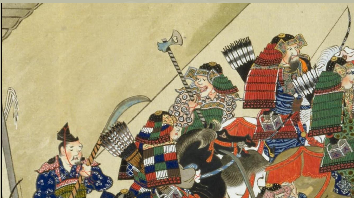
Szamuráj harci fejszével; részlet a 春日権現験記-ből. 第8軸-ból.

Ono (斧) vagy Fuetsu (斧鉞) néven is ismert, ez a fegyver, amit kevesen hoznak összefüggésbe a szamuráj háborúkkal.