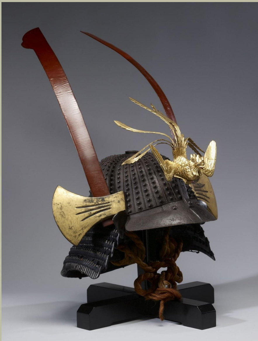
Iker balták, amelyeket Maedate -ként használtak ehhez a Kabuto -hoz, amelyet egy híres Myochin páncél készítő készített.

Azonban ki kell emelni, hogy annak ellenére, hogy vannak bizonyítékok azok tényleges felhasználásáról, a harci balták meglehetősen ritkák voltak, és később megpróbálunk magyarázatot adni erre a tényre.