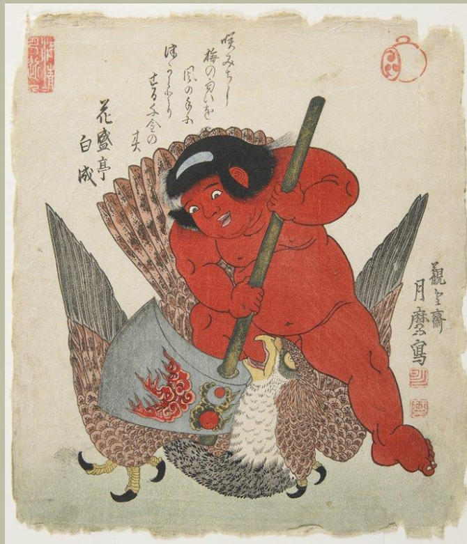
Kintaro a hatalmas baltájával.