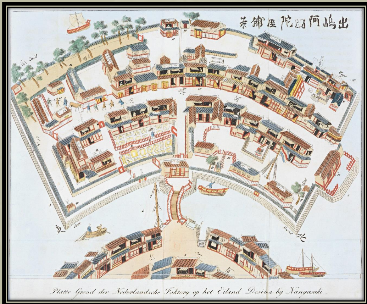
A Nagaszaki Dejima szigetén lévő holland kereskedelmi állomás alaprajza.

Az európai hajók kikötői belépései fokozatosan korlátozottakká váltak, végül a spanyoloknak nem engedték, hogy Japánba érkezzenek, majd később már a portugálokat sem engedték be. Dejima (japánul: 出島, "kijárat sziget"), a 17. században Tsukishima (築島, "épített sziget") néven is emlegetett, a Nagaszaki előtt fekvő mesterséges sziget, amely a portugálok (1570-1639), majd a hollandok (1641-1854) kereskedelmi állomásaként szolgált.