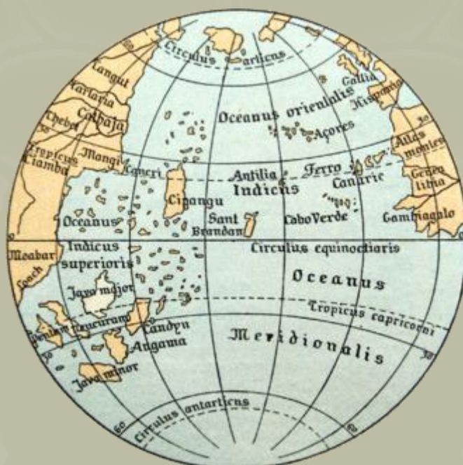
Cipangu ábrázolása az 1492-es Martin Beham féle földgömbön.

A cikk írója számos referenciát vizsgált meg és kereste a tényeket. A kutatás eredménye az, hogy a mai világ aranykészletének 1/3-a Japánból származott, amelyet a múltban bányásztak. (Kérjük, ne idézze ezt az információt a szerző nevével összekapcsolva.) Az arany az évszázadok során apránként kifolyt Japánon kívülre, mivel az arany és az ezüst közötti átváltási árfolyam Japánban sokkal olcsóbb volt, mint a világ többi részén. Az arany hosszú idő alatt áramlott ki Japánból. Most már nem bányásznak aranyat, és nem is sok aranya van japánnak. Azt mondják, hogy a Japán országnév Marco Polo könyvéből származik. Az országot könyvében „Chipangu” -nak nevezte, ez azt jelenti az arany országa. „Chipangu”, „Zipang”, „Jipang” végül „Japánná” alakult. A japánok nem nevezik magukat Japánnak. „Nihon vagy Nippon” (日本) az országunk neve.