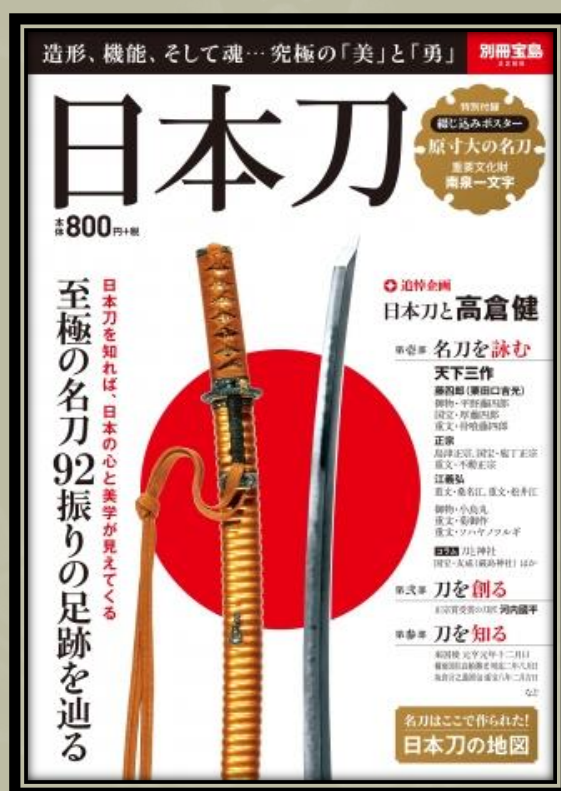
A Japán kard Nihonto . Bessatsu Takarajima Magazin.

A történelem új rajongótáborra talált. Bemutatkozik a rekijo - a történelem női rajongói. Más otaku -csoportokhoz hasonlóan a rekijo is a pénztárcájával mutatja ki rajongását. A Takarajima kiadó szerint a 20-as éveikben járó nők a Nihontō (szó szerint: japán kard) könyvsorozat legújabb kiadásait vásárló legnagyobb demográfiai csoport, ami messze elmarad a várt 40-60 év közötti férfi vásárlóktól.