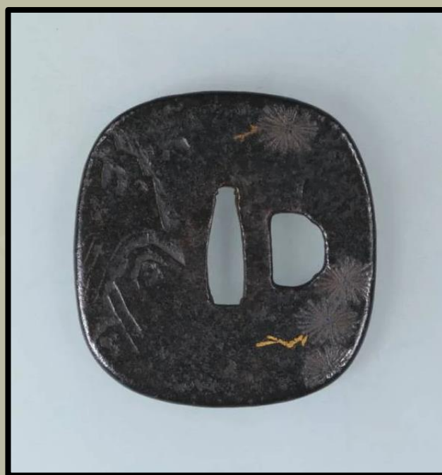
Tsuba "Sólyom", XVII. század. (Tokiói Nemzeti Múzeum)

A tsubako számos iskolája közül az egyik az Ito iskola volt, amelyet ismét Owari Ito Masatsugu tartományban alapítottak. Az iskola stílusát az áttört díszítések jellemezték. A tsubába vékony lyukat fúrtak, ebbe drótot illesztettek, és így fűrészelték olajozott acéldrót és csiszolópor segítségével. Az egyik népszerű motívum valamiért a labirintus volt. Ezen kívül egy bonyolult, arannyal berakott díszítést is végeztek a tsuba felületén.