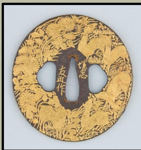
Tsuba "A rénszarvas", Shoami stílusban. 1615 – 1868.

A Shoami tsuba fő megkülönböztető jegye a tsuba felületének arany-, ezüst-, réz-, vas-, bronzbevonattal való bevonási technológiája. És az egész képet úgy hozták létre, hogy teljesen kitöltötte a tsuba minden szabad helyét. Az intarziát a perem áttört vésetei és díszítései egészítették ki, ami más iskolák tsubáin általában nem volt megfigyelhetőek. Ilyen például a "Rénszarvas" tsuba , amely nagyon gazdagon díszítettnek tűnik, mivel gyakorlatilag alig van rajta szabadon látható fém felület. A rajta lévő, Nunome-Zogan technikával, aranyból készült szarvasok képei levelekkel, szárakkal és virágokkal vannak összefonódva.