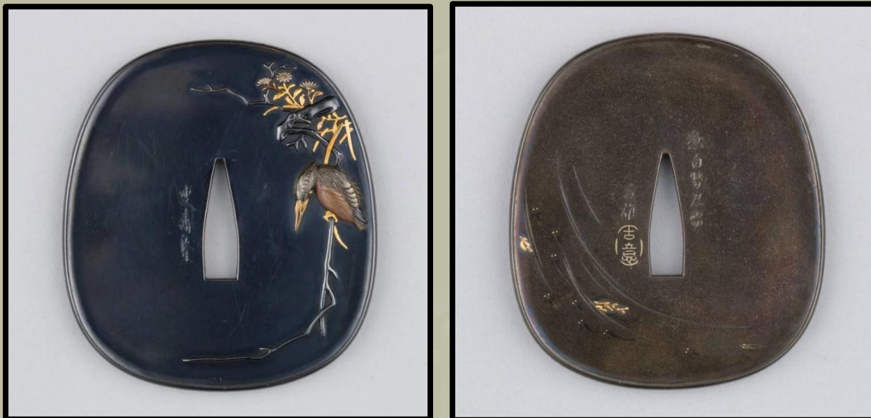
A tsuba előnézete és hátoldala.