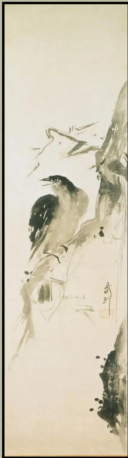
Madár az ágon

„Az ácsmunka összehasonlítása a stratégiával, a házakkal való kapcsolaton keresztül történik. A nemesek házai, a harcosok házai, a Négy ház, a házak romjai, a házak virágzása, a ház stílusa, a ház hagyománya és a ház neve.