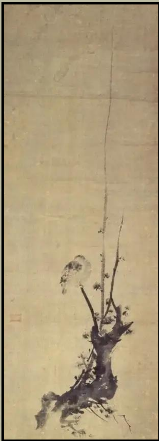
梅鳩図(umehatozu) Szilva és galamb

A fordítás az alábbi cikk felhasználásával történt: https://medium.com/hakubutsukan/the-art-of-miyamoto-musashi-e154e694d435