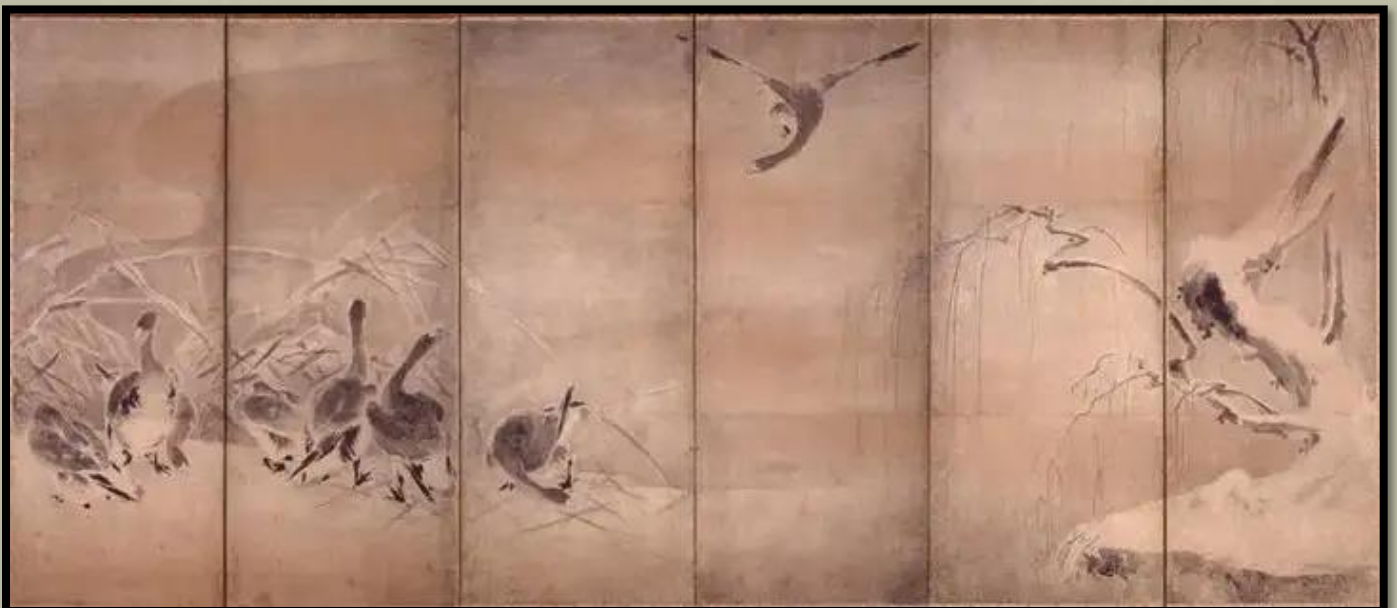
芦雁图 (Roganzu) Nádas és vadludak. A kép bal oldala.

„Így a stratégia erényével sok művészetet és képességet gyakorlok - mindent, aminek nincs tanítója.”