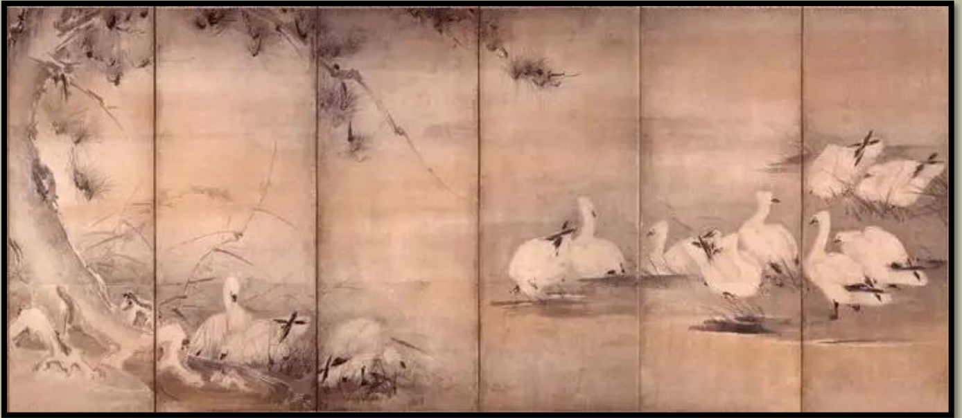
芦雁图 (Roganzu) Nádas és vadlibák. A kép jobb oldala.

„Így a stratégia erényével sok művészetet és képességet gyakorlok - mindent, aminek nincs tanítója.”