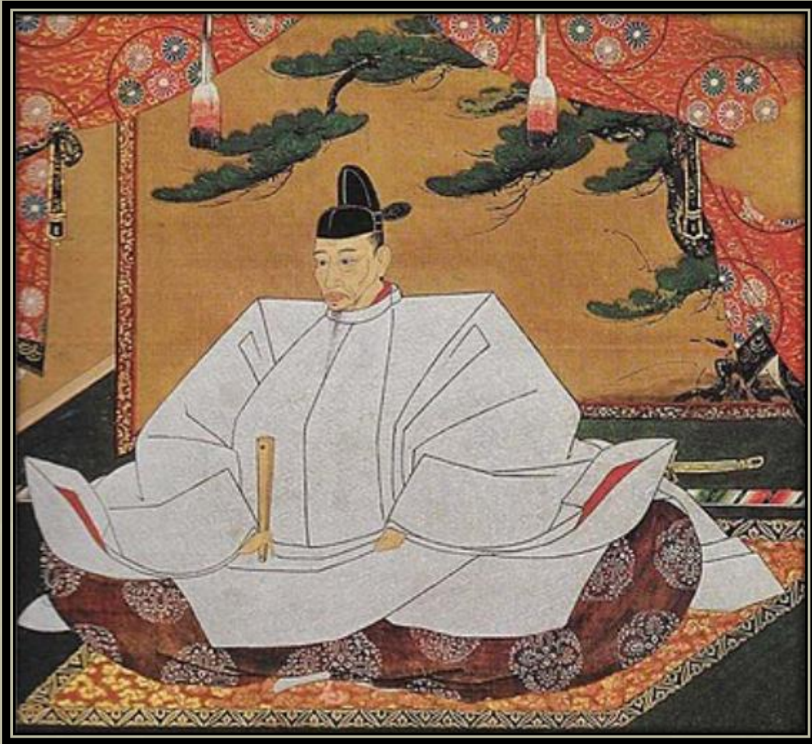
Toyotomi Hideyoshi, Mitsunobu Kanou, a Kodaiji-Templom tulajdonában.

A Wikimedia Commonsból, az ingyenes médiatárból