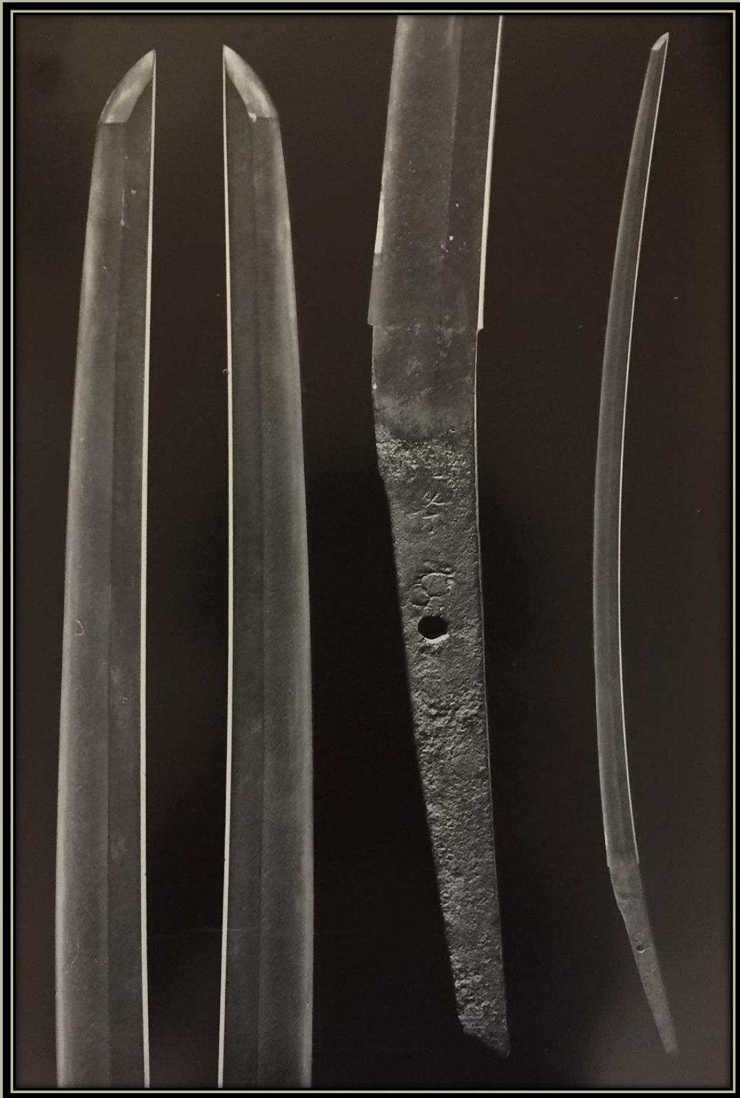
Sanjo Munechiak (三条宗近) A Showa Dai Mei-to Zufu-ból (昭和大名刀図譜) az NBTHK által. A Tokiói Nemzeti Múzeum tulajdona.