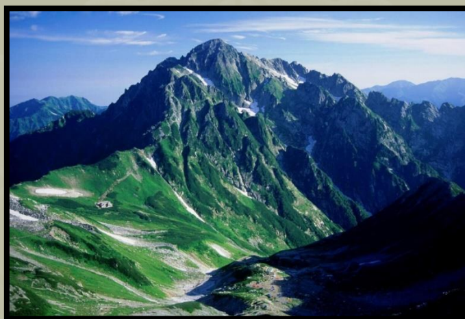
A Tsurugi hegy

A Shikoku szigeten található Tsurugi hegy a második legmagasabb hegy, amely Japán Tokushima prefektúra szívében található. Jelentős a Shugendo , a japán vallás számára is, amely a népi hiedelmeket az őshonos sintó és a buddhizmus vallásával ötvözi.