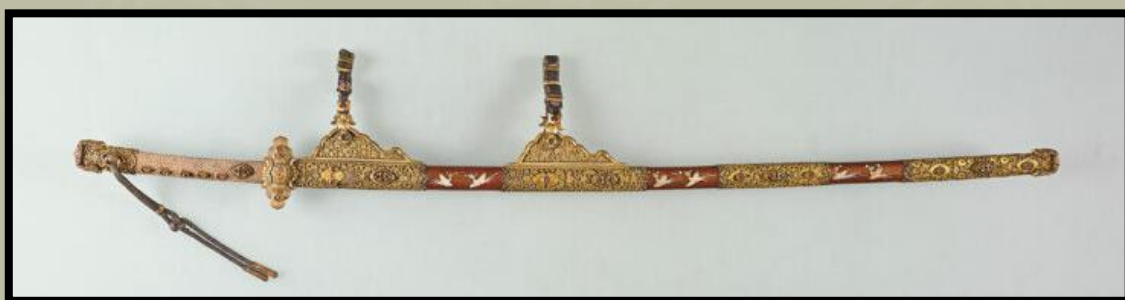
Szertartásos kardszerelék ( Kazari Tachi ) gyöngyházberakásos díszítéssel és arany szerelésekkel, nashiji lakkozott felületen. (Heian-korszak, 12. század)

A Heian -korszakban a japán pengék eltávolodtak az egyenes és terjedelmes tsurugi kialakítástól. A Heian -korszak közepén sok kardkovács kezdett el kísérletezni az ívelt és differenciáltan edzett pengékkel, amelyek később meghatározták a japán kardot. Az ívelt, egyélű penge a japán kardot vágófegyverré tette, és az ívelt tachi a Heian -kori harcosok standard fegyverévé vált.